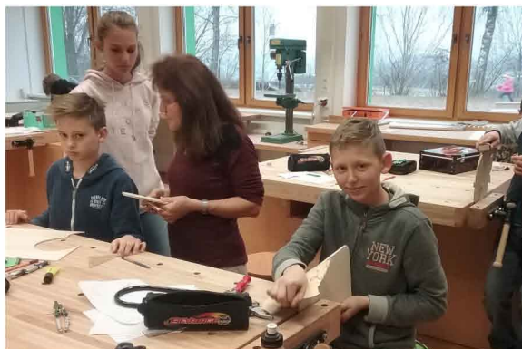
Burschen und Mädchen der 1a bei der Ausdauerarbeit im neu gestalteten Turnsaal